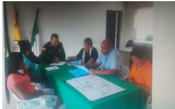
Articulación mujeres TRABAJADORAS SEXUALES