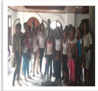
EQUIPO DE TRABAJO