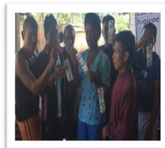
ASESORIA USO DEL PRESERVATIVO