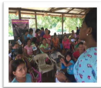
GRUPOS CLAVES PRIORIZADOS