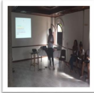
EQUIPO DE TRBAJO