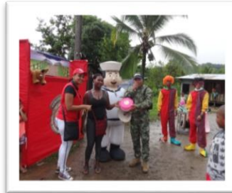
JOVENES EN CONDICIÓN DE DESPLAZAMIENTO